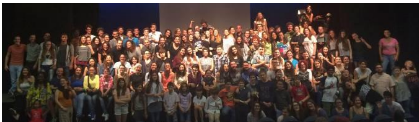
La celebrazione dei vent'anni del Festival con i partecipanti delle passate edizioni, dal 1995 al 2015

2024 – riprende anche la sezione concorso del Festival delle Scuole