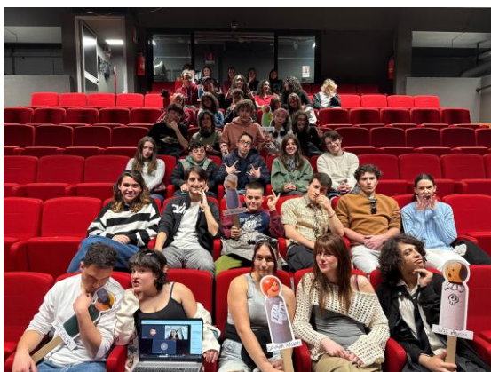
Festival 2025: la Giuria di ragazzi e ragazze

originalità, costumi, scene e musiche degli spettacoli in gara. La giuria è senz'altro una delle cose più belle nonché il simbolo di questa rassegna dedicata ai più giovani. Al termine della manifestazione, durante la Cerimonia di Premiazione che si terrà domenica 31 maggio 2026 all'ITC Teatro di San Lazzaro, verranno annunciate le scuole prima, seconda e terza classificata. Diversamente dalle edizioni precedenti, a causa di forti tagli ai finanziamenti, non è previsto un premio in denaro . Per approfondire le motivazioni, clicca qui .