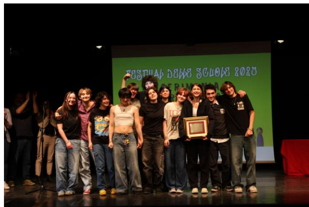
I vincitori dell'edizione 2025: Istituto Trissino di Valdagno