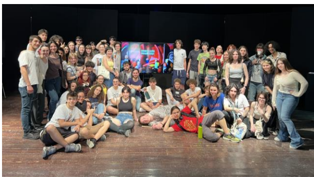
Festival 2024: la Giuria di ragazzi e ragazze

Novità di quest'anno! Sabato 24 e domenica 25 maggio tutti i partecipanti potranno prendere parte a un workshop gratuito che culminerà con un flashmob. I ragazzi e le ragazze dei vari gruppi avranno così la possibilità di lavorare insieme, guidati degli operatori del Teatro dell'Argine, e dare vita a un momento di teatro e festa che si terrà in seguito alla Cerimonia di Premiazione.