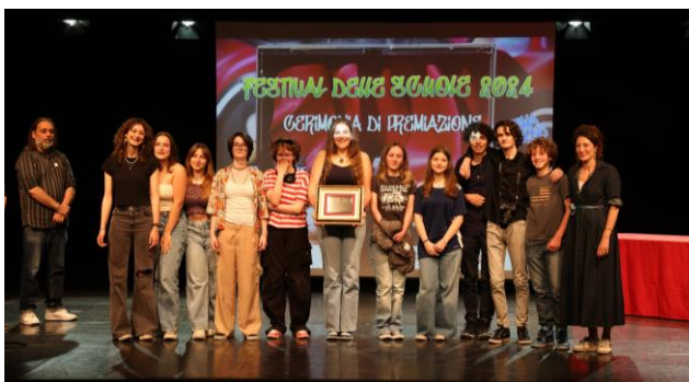
I vincitori dell'edizione 2024: Liceo Righi di Bologna